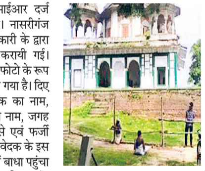
एजेसी ►► फतेहपुर

यूपी के फतेहपुर में मकबरा और मंदिर विवाद को लेकर हुए बवाल पर समाजवादी पार्टी के अध्यक्ष अखिलेश यादव ने बीजेपी पर बड़ा हमला बोला है। अखिलेश यादव ने कहा कि जब आजपा वाले अष्टाचार, आय दोगुणी, कानून व्यवस्था पर फंस जाते हैं तो नफरत फैलाने लगते हैं। आजपा के लोग इस मामले में बहुत ट्रेड हैं। समाज बंद, नफरत बढ़े, दूरियां फेंके तभी यह लोग कामयाब होंगे। तभी यह लोग अपनी राजनीति में कामयाब होंगे। यह लोग अंबेजो वाली विचारधारा पर चल रहे हैं।