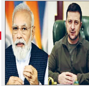
हरिभूमि ब्यूरो ►► नई दिल्ली

पीएम ने संघर्ष के शीघ्र और शांतिपूर्ण समाधान को लेकर भारत की तरफ से हर संभव योगदान देने की जताई प्रतिबद्धता