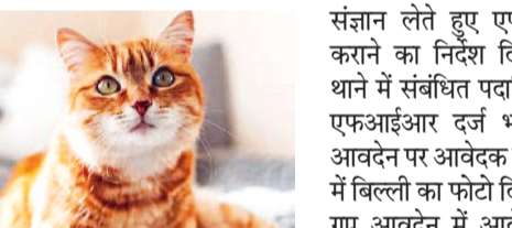
एजेसी ►► सासाराम

संज्ञान लेते हुए एफआईआर दर्ज कराने का निर्देश दिया। नासरीगंज थाने में संबंधित पदाधिकारी के द्वारा एफआईआर दर्ज भी कराया गई। आवेदने पर आवेदक के फोटो के रूप में बिल्ली का फोटो दिया गया है। दिए गए आवेदने में आवेदक का नाम, पिता का नाम, माता का नाम, जगह तथा चित्र गलत ढंग से एवं फर्जी प्रस्तुत किया गया है। आवेदक के इस कृत्य से सरकारी कार्य में बाधा पहुंचा है। सरकारी व्यवस्था के प्रति शडयंत्र कर जनता के बीच छवि धूमिल करने का प्रयास किया गया है।