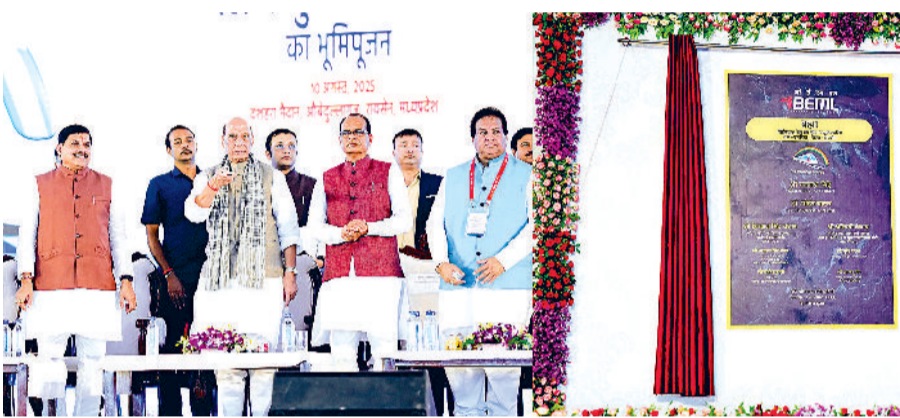
मग्न रेलवे की मैन्युफेक्चरिंग और एक्सपोर्टिंग का केंद्र