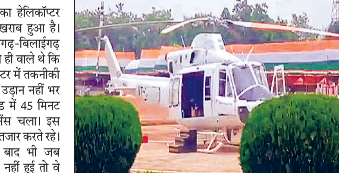
सीएम का दौरा प्रभावित हुआ

निर्धारित कार्यक्रम के मुताबिक, सोमवार (11 अगस्त) को सीएम साय सुबह 11:25 बजे सारंगगढ़ बिलाईगढ़ जिला मुख्यालय पहुंचने वाले थे। 12:15 बजे सारंगगढ़ बिलाईगढ़ जिला मुख्यालय पहुंचने वाले थे। लेकिन दौरा शुरू होने से पहले ही प्रभावित हो गया। 12:15 बजे सारंगगढ़-बिलाईगढ़ जिला मुख्यालय पहुंचना था। लेकिन हेलिकॉप्टर की तकनीकी दिक्कत के चलते सीएम साय का पूरा शेड्यूल बिगड़ गया। हेलीकाप्टर खराबी के रवाना पर सीएम निक्कोरिटी और जिम्मेदार अधिकारियों का फिलहाल कोई बयान सामने नहीं आया है।